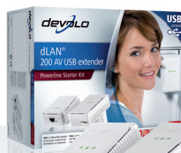
dLAN® 200 AV USB extender Starter Kit