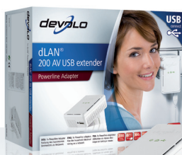
dLAN® 200 AV USB extender